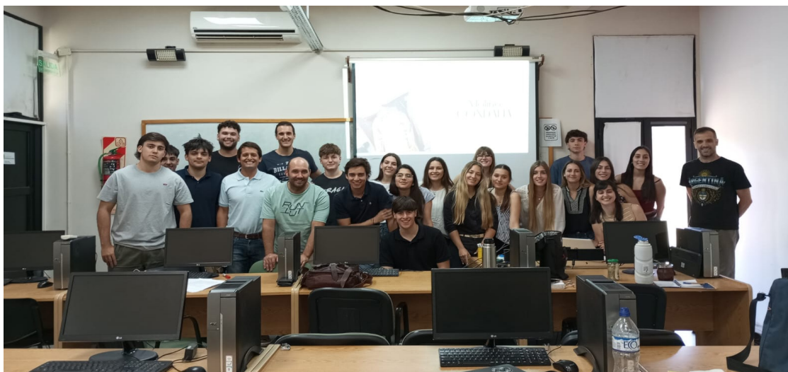
Figura 6. Cierre de cursada, trabajo práctico y primeras actividades de extensión 2025

La siguiente figura sintetiza el cierre de estas actividades y aprendizajes colectivos, basados en el anclaje territorial de la enseñanza, el reconocimiento de saberes situados y la construcción de relaciones humanas e institucionales que pueden potenciar la continuidad de la experiencia en el tiempo.