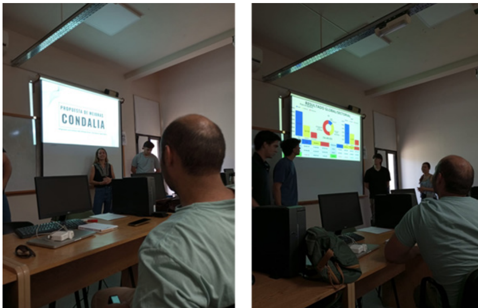
Figura 4. Presentación de resultados en el aula-taller