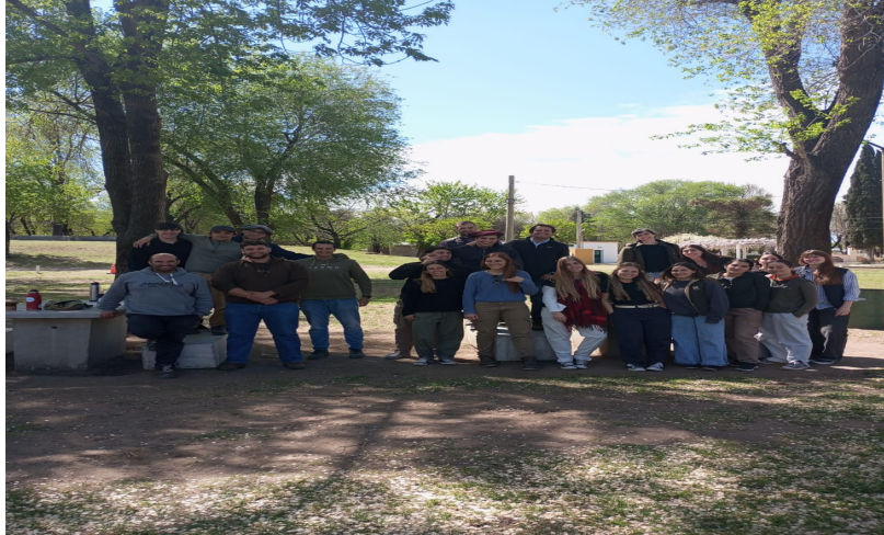
Figura 3. Taller de cierre de actividad en el territorio

fue discutido colectivamente y contrastado con los emprendedores. La jornada en General Acha finalizó con un espacio de intercambio informal, en el que se profundizaron aspectos de la trayectoria del emprendimiento y de las decisiones que luego debían ser analizadas en el trabajo práctico (figura 3).