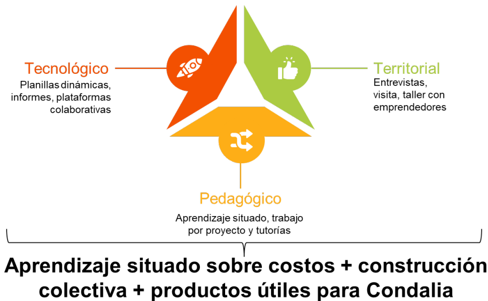
Figura 1. Metodología de trabajo triple impacto