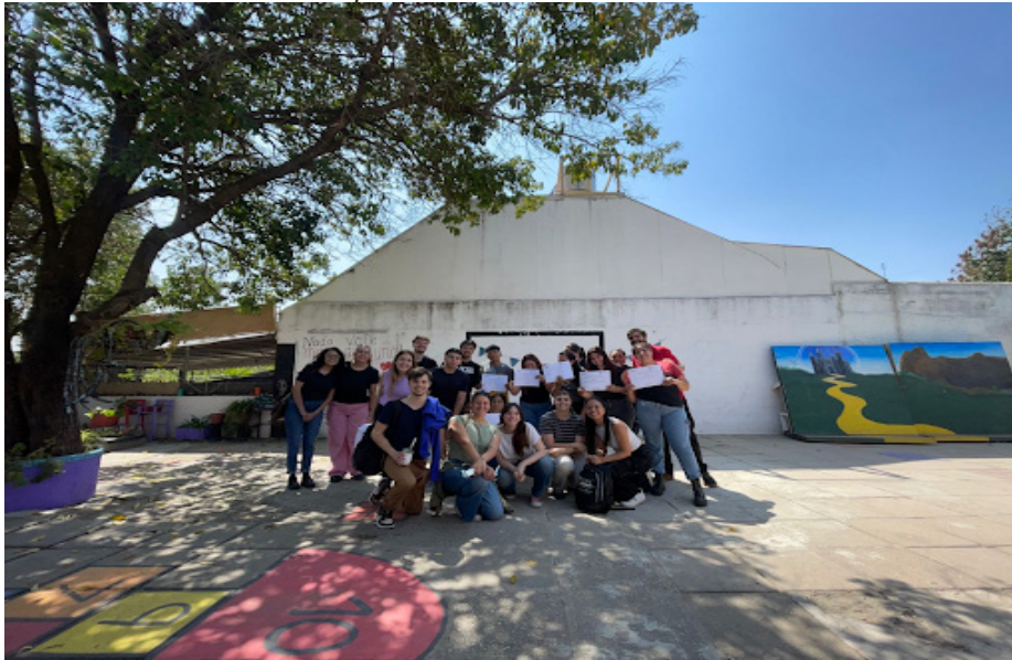
Figura 5. Foto grupal del encuentro de cierre y entrega de certificados del proyecto “Fortaleciendo espacios de convivencia de inclusión social”

los aprendizajes adquiridos y las experiencias compartidas. Como reconocimiento, se entregaron certificados de participación emitidos por SPyRSU de la UCC. La Figura 6 registra este momento de cierre, en el que participantes y talleristas compartieron una instancia significativa de valoración mutua y celebración.