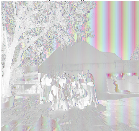
Figura 4. Imagen de los encuentros en el Centro Cultural Patito Feo

A lo largo de los encuentros, se promovió un clima de participación activa, escucha horizontal y construcción colectiva de saberes. Las Figuras 3 y 4 ilustran distintos momentos del proceso: en un caso, el trabajo con herramientas digitales para la confección de CV y el uso de correo electrónico; en el otro, una instancia de reflexión vocacional en el espacio abierto del centro comunitario. Ambas escenas evidencian la apropiación del espacio por parte de las y los participantes y el compromiso del estudiantado en su rol de talleristas.